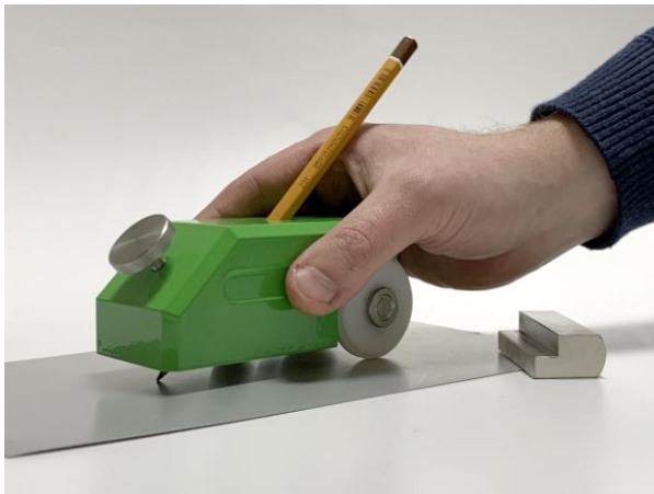
Рисунок 2.2 – Проведение испытания