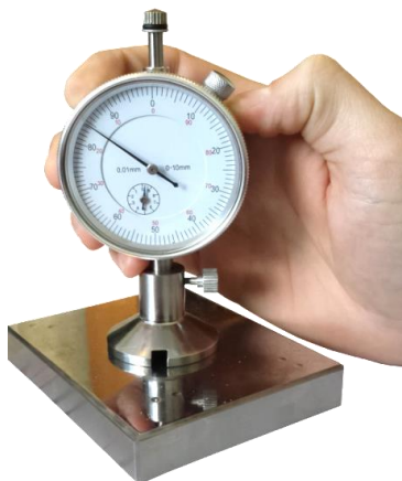
Рисунок 2.2 – Прибор во время проведения измерения