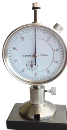
Рисунок 2.1 – Установка нуля глубиномера